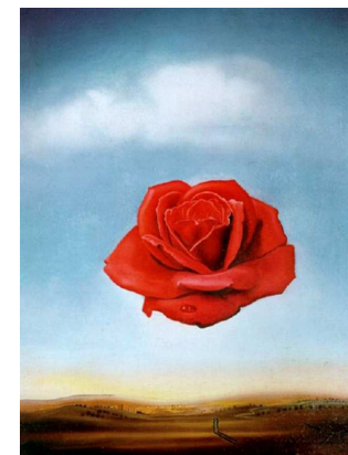
Die meditative Rose Salvador Dali